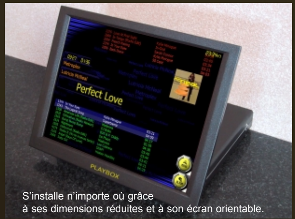
S'installe n'importe où grâce à ses dimensions réduites et à son écran orientable.

Logo de l'établissement bien visible, possibilité de faire défiler automatiquement à intervalles de temps choisis, publicités, annonces, vidéos, menus ou offres spéciales, en mode plein écran.